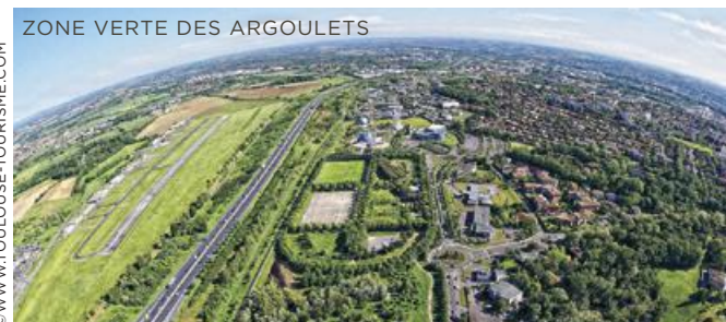
ZONE VERTE DES ARGOULETS

Qualité architecturale, invitation au « bien vivre ensemble » et intégration environnementale sont les maîtres mots qui définissent cet éco-quartier en devenir.