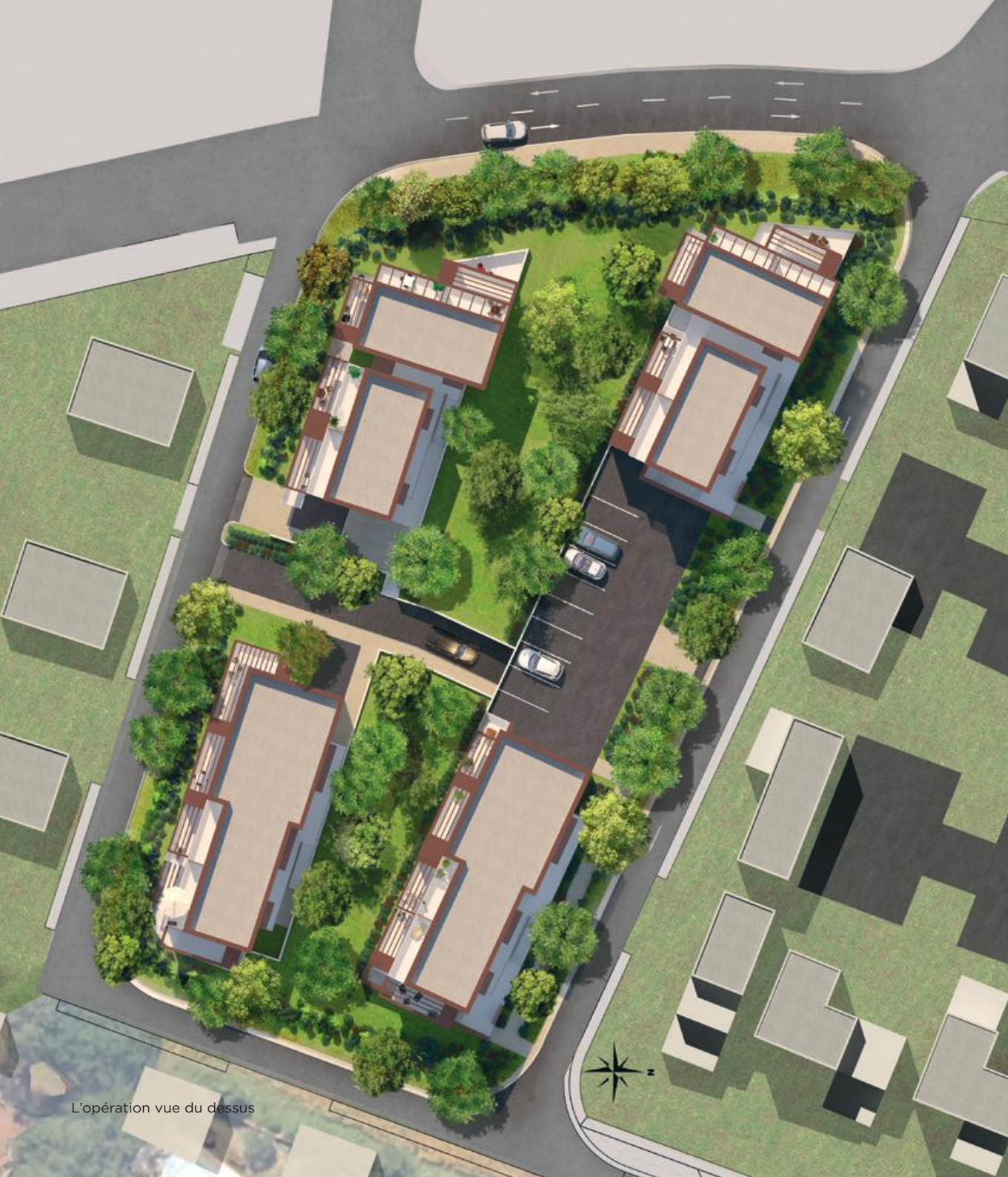
L'opération vue du dessus