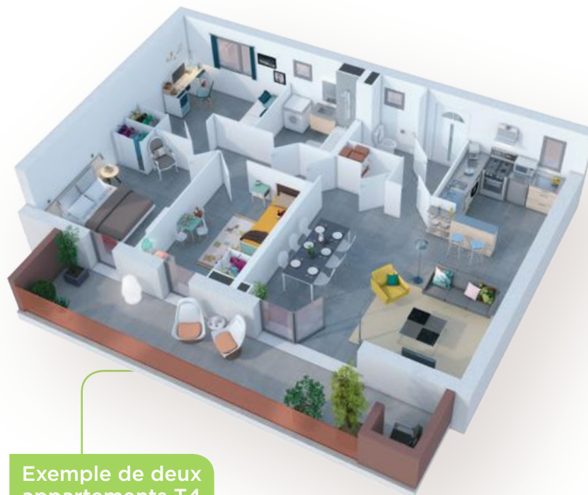
Exemple de deux appartements T4 avec balcon